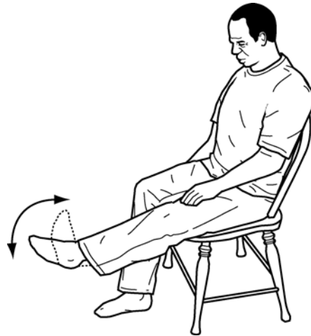
Exercícios com o tornozelo